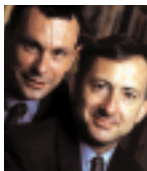
Par Olivier Davanne et Thierry Pujol Associés de DPA Conseil

A près les avoir trop adorées, divers conseillers en investissement vouent désormais les actions aux gémonies. Mais, est-ce le triomphe de la raison ou la réaction émotionnelle d'investisseurs déçus ? Pour juger de l'opportunité d'acheter des actions dans une perspective de long terme, il faut évaluer les rendements qu'elles procureront dans la durée, en faisant – dans un premier temps – abstraction des risques de crises géopolitiques, économiques ou financières. Armé de ces rendements de long terme, l'investisseur peut ensuite faire un choix raisonné entre le risque des actions ou la sécurité des obligations.